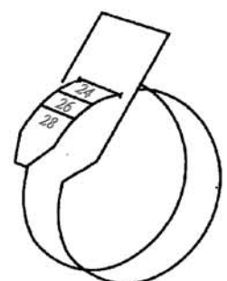
Ejemplo talla 24